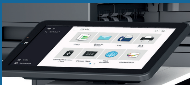
NOUVEL ECRAN TACTILE 10,1 POUCHES