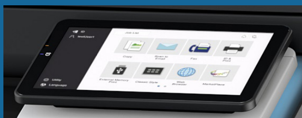
Nouvel écran tactile 10,1 pouces avec feedback par vibrations