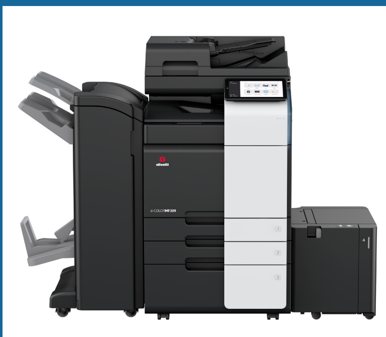
d-Color MF309 équipé DF-714 + PC-416 + LU-302 + RU-513 + FS-536SD